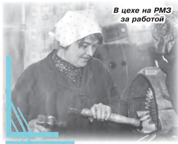
В цехе на РМЗ за работой