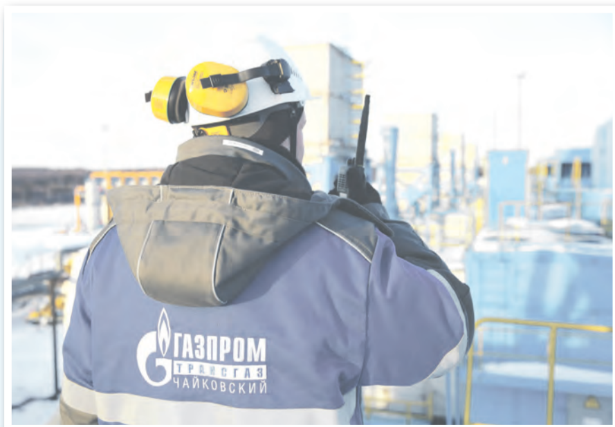
40 лет обеспечивают надёжный транспорт газа работники «Газпром трансгаз Чайковский»