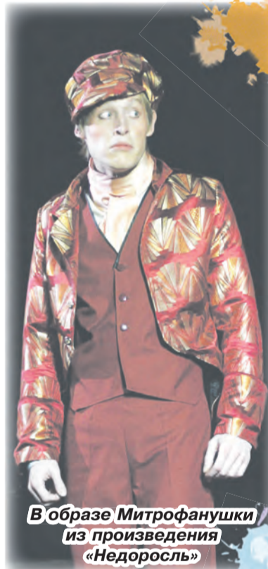
В образе Митрофанушки из произведения «Недоросль»