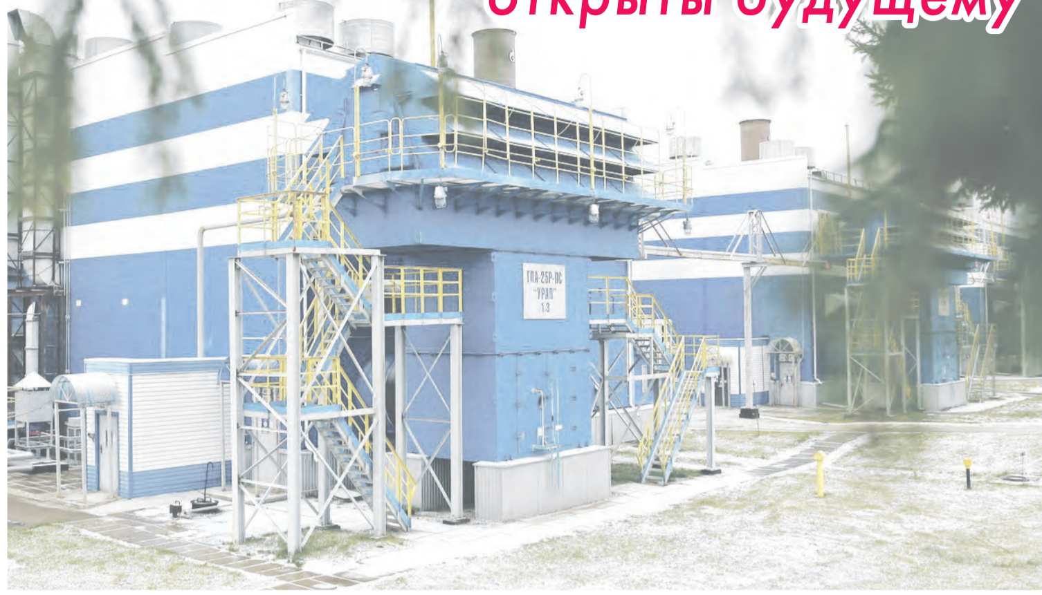
Компрессорная станция «Игринская»