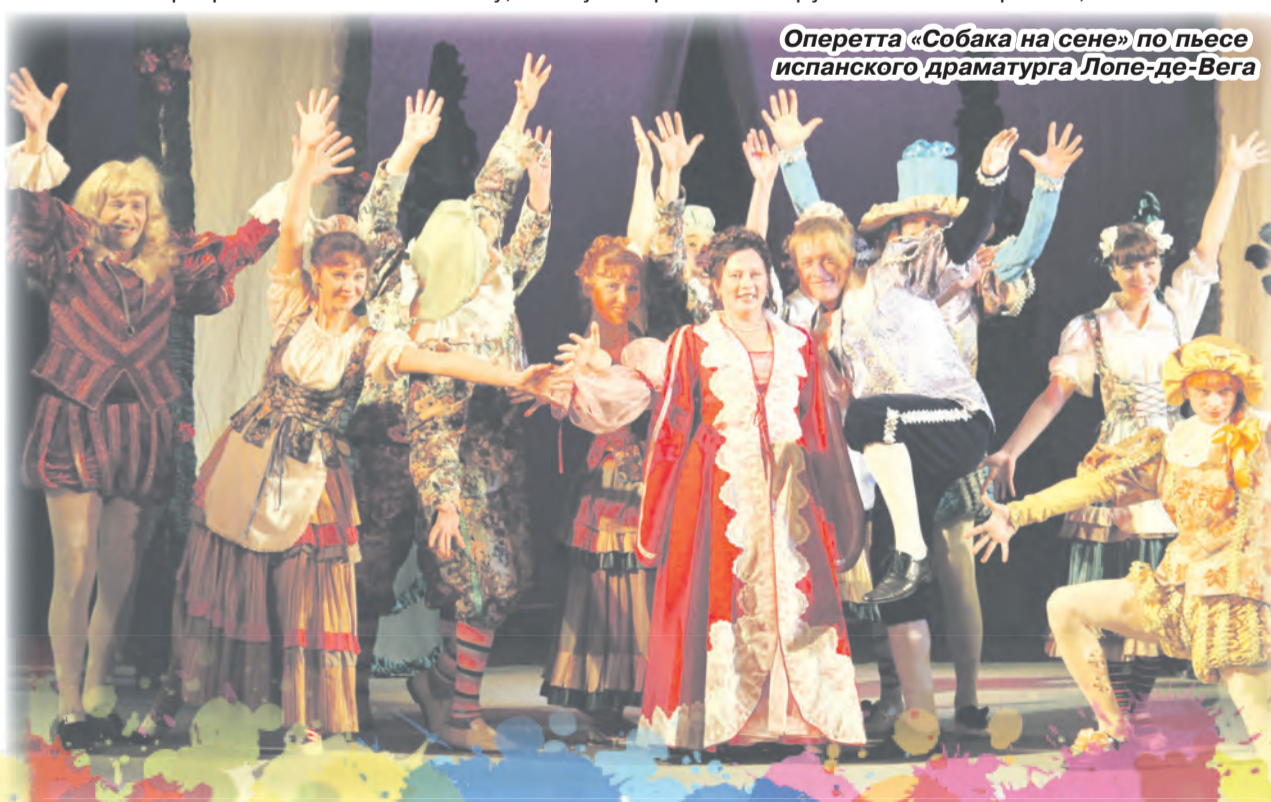
Оперетта «Собака на сене» по пьесе испанского драматурга Лопе-де-Вега