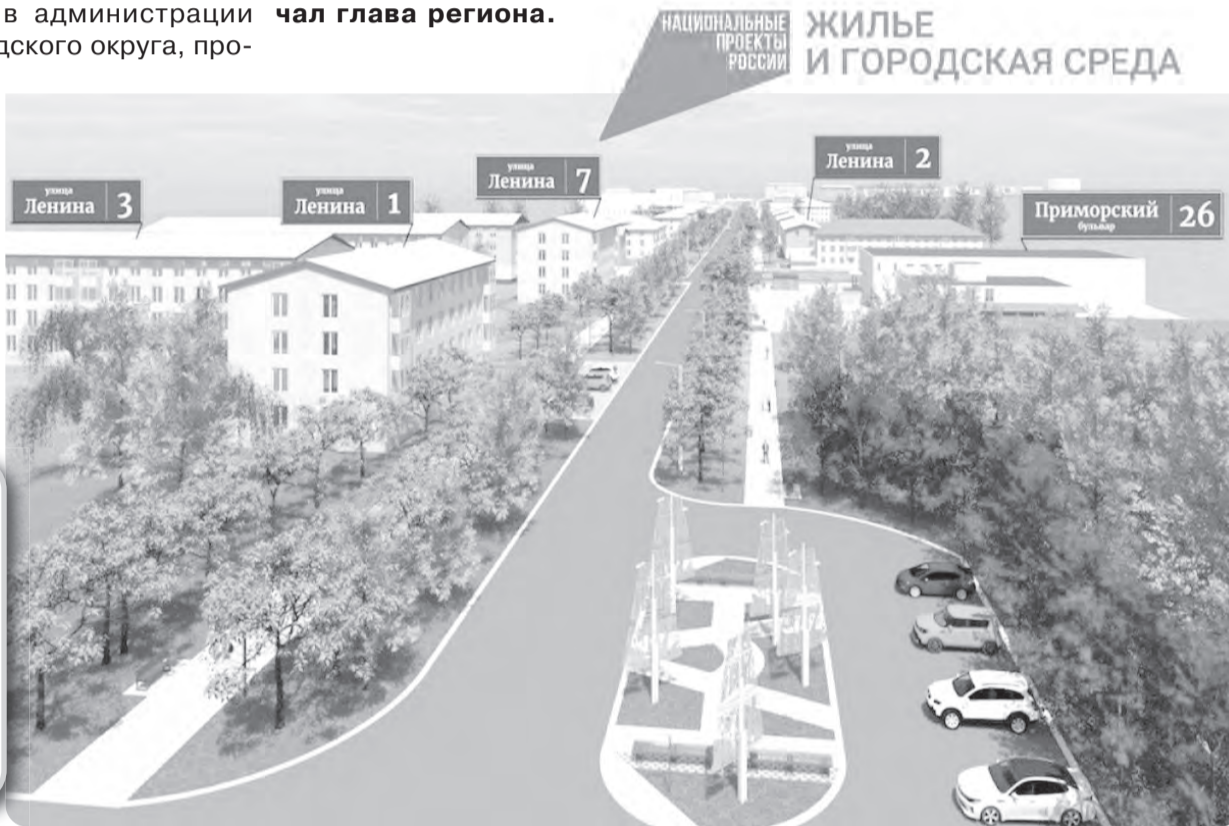
Материалы подготовила Инна ПЛЕТНЁВА

Стоит отметить, что до 30 апреля продолжается голосование за объект, который будет преобразён в следующем году. На сегодняшний день вновь лидирует улица Ленина – дальнейшее её благоустройство, за что отдали свои голоса более 13 тысяч жителей.