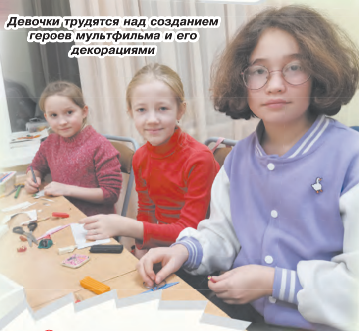
Девочки трудятся над созданием героев мультфильма и его декорациями

Мне нравится, что мы не только придумываем сюжет мультфильма, но и сами создаём его: рисуем, лепим, фотографируем, озвучиваем. Самое интересное для меня – это создание героя»