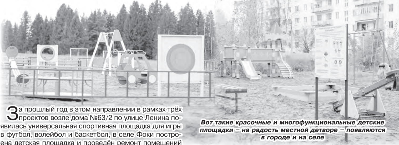
Вот такие красочные и многофункциональные детские площадки – на радость местной детворе – появляются в городе и на селе

Вот уже на протяжении нескольких лет, благодаря реализации проектов инициативного бюджетирования, на территории Чайковского округа строятся детские и спортивные площадки, в школьных спортзалах появляется новый инвентарь, обустраиваются спортивными тренажёрами общественные пространства.