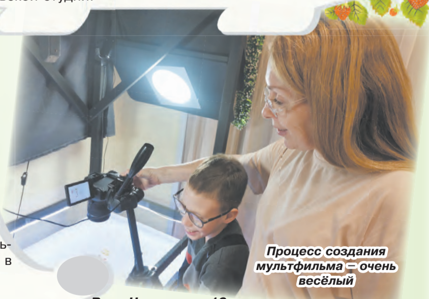
Процесс создания мультфильма – очень весёлый