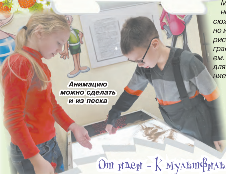
Анимацию можно сделать и из песка

В ноябре 2023 года студии приняли участие в конкурсе «Гаджет анимация», который проходил в Перми. Вернулись ребята с двумя дипломами первой степени. Также в краевой столице проходил кинофестиваль «Радуга Прикамья», где чайковцы познакомили его участников со своими мультфильмами «Сабантуй» и «Лис и Мышонок». На фестивале детско-короткометражного кино «Детский Питеркит» в Санкт-Петербурге был показан мультфильм «Дедушка Мазай и зайки», созданный в чайковской студии.