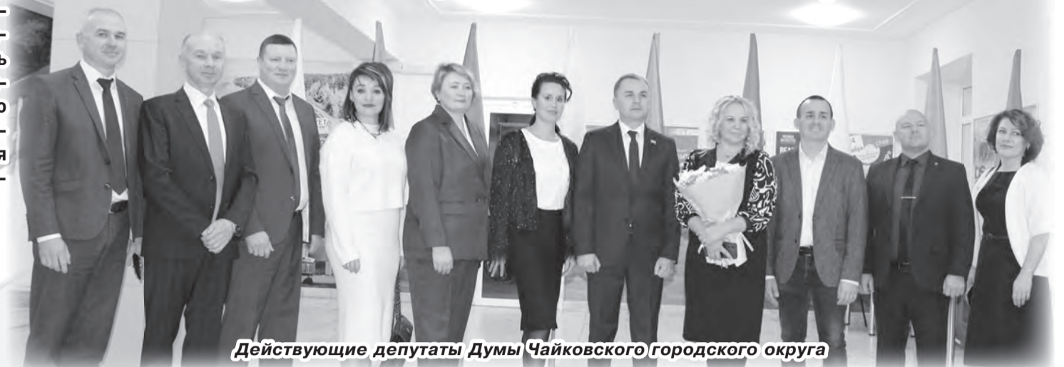
Действующие депутаты Думы Чайковского городского округа

В ту пору бурные (мягко говоря) заседания Думы продолжались порой с 10 утра до 6-7 часов вечера, особенно, когда обсуждались такие «зубодробильные» вопросы, как тарифы на