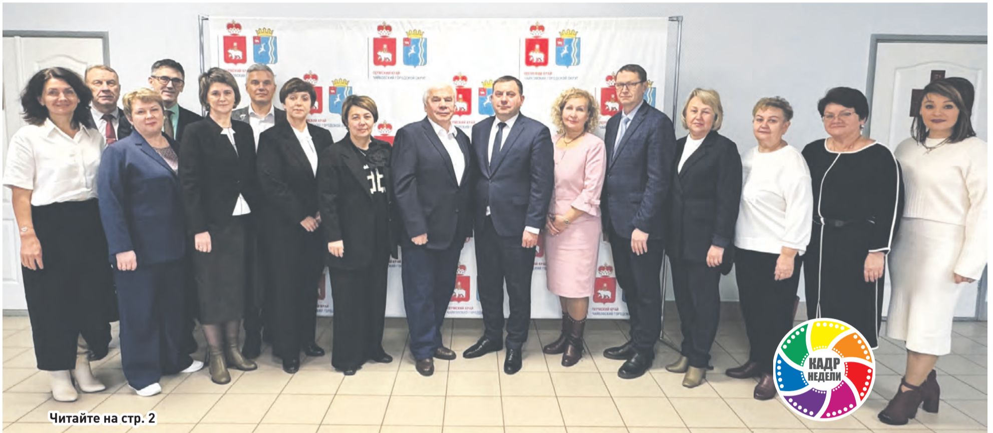
Читайте на стр. 2