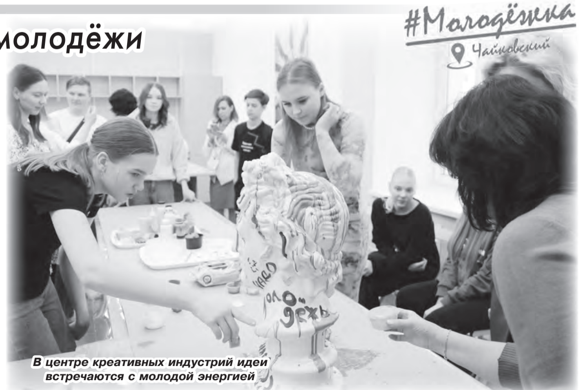
В центре креативных индустрий идеи встречаются с молодой энергией

С созданием новой инфраструктуры развитие молодёжной политики на территории будет многогранным. Здесь объединятся сразу несколько направлений, поэтому каждый найдёт занятие по душе: будь то арт-индустрия, медиа, дизайн, музыка или IT. В центре разместятся творческие коллективы, объединения и молодёжные сообщества.