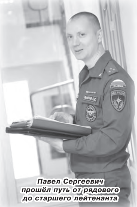
Павел Сергеевич прошёл путь от рядового до старшего лейтенанта

– За это время поменялось очень многое: график работы, увеличилась ответственность за подчинённых, которых в пожарной части по шта-