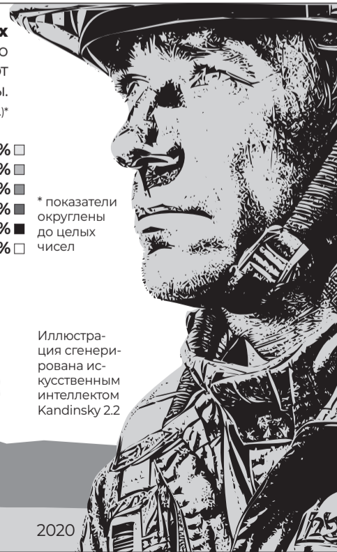
Иллюстрация сгенерирована искусственным интеллектом Kandinsky 2.2