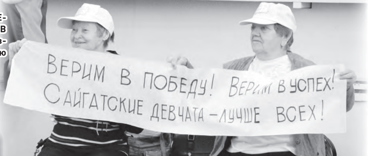
Успех команды зависит и от группы поддержки