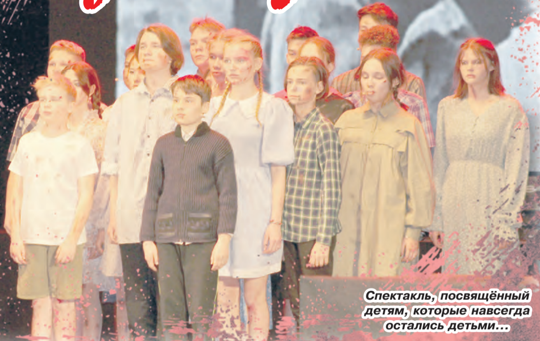
Спектакль, посвящённый детям, которые навсегда остались детьми...

Все участники этой постановки – ученики гимназии. Они провели большую работу, неустанно репетируя на протяжении месяца по 2-3 часа после уроков почти каждый день.