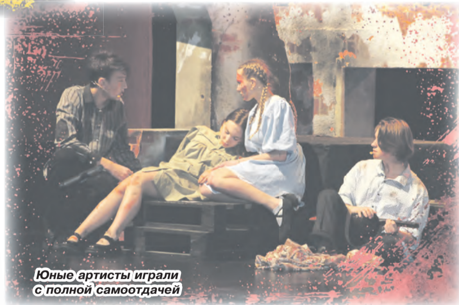
Юные артисты играли с полной самоотдачей

Спектакль длился почти час и всё это время от действий на сцене невозможно было оторваться. Юные артисты, хоть и непрофессиональные, довольно правдиво показали одну из страниц великой истории.