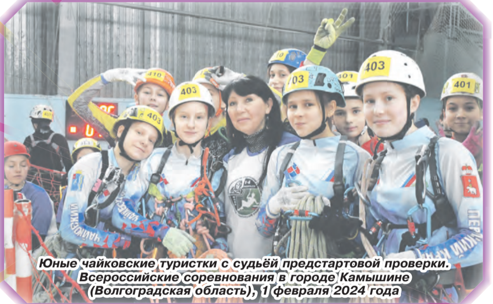
Юные чайковские туристки с судьёй предстартовой проверки. Всероссийские соревнования в городе Камышине (Волгоградская область), 1 февраля 2024 года