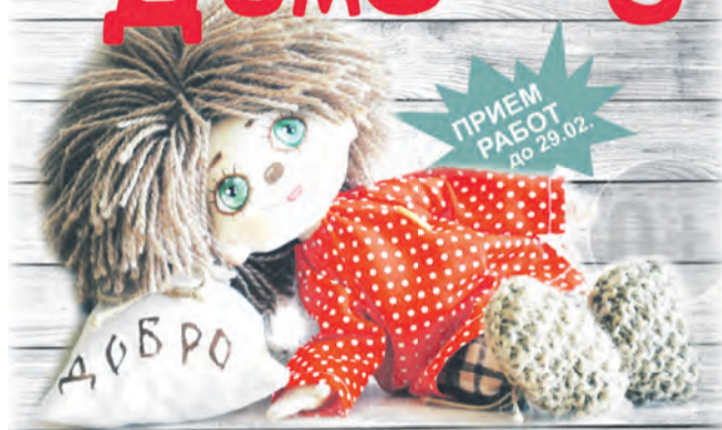
КОНКУРС-ВЫСТАВКА РУКОТВОРНЫХ ИЗДЕЛИЙ

Центр ремёсел Чайковского центра развития культуры начинает приём работ на межрегиональный конкурс-выставку «Именины Домового».