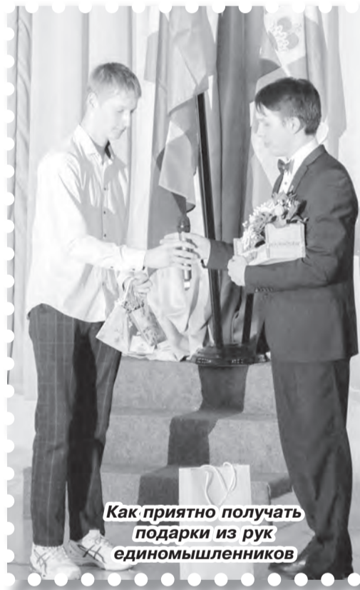
Как приятно получать подарки из рук единомышленников

А гвоздём программы стал «Зимний» бал и поздравление друг друга в игре «Тайный друг».