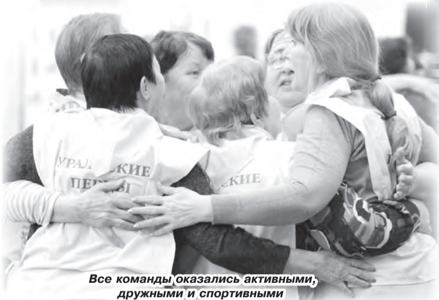
Все команды оказались активными, дружными и спортивными

Участники этих соревнований – мужчины от 60-ти и женщины от 55-ти лет. Все они придерживаются активного образа жизни и всегда выступают за то, чтобы не только весело, но и с пользой для здоровья проводить время.