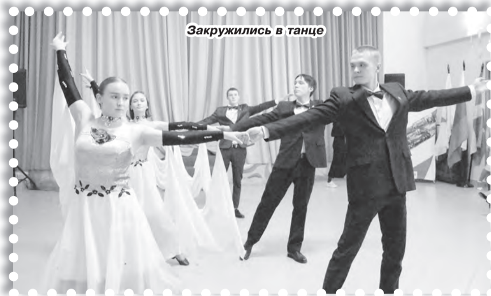
Закружились в танце

Бесспорно, все присутствующие на этом мероприятии зарядились положительными эмоциями, энергией и стремлением к новым победам. Пусть местному отделению «Движение Первых» всего один год, но наши активисты настроены многое успеть и познать ещё больше нового и интересного в этом году. До новых встреч и вперёд, Первые!