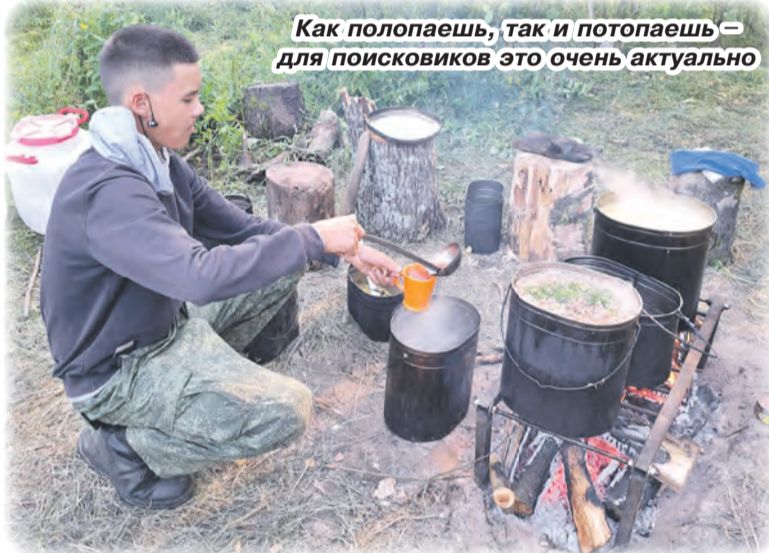
Как полопаешь, так и потопашь – для поисковиков это очень актуально

Вообще-то это непростой вопрос – что такое патриотизм, каковы его критерии, с чего он начинается и как его воспитывать? В свободный день была организована поездка поисковиков в Великий Новгород с посещением Кремля и осмотром памятника «Тысячелетие России». На следующий день состоялся просмотр фильма «Господин Великий Новгород», в котором события августа 1941 года переплетаются с исторической ретроспективой о борьбе Александра Невского с иноземными захватчиками. Благодаря тому, что дети многое увидели своими глазами, у них поменялось отношение к истории страны, сформировалась своя твёрдая позиция в сражениях на полях информационной войны.