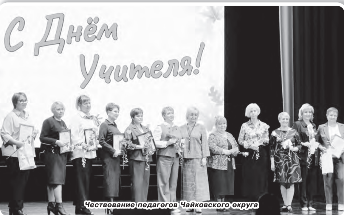
Чествование педагогов Чайковского округа