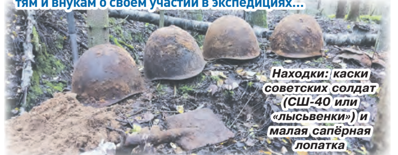
Находки: каски советских солдат (СШ-40 или «Лысьвенки») и малая сапёрная лопатка