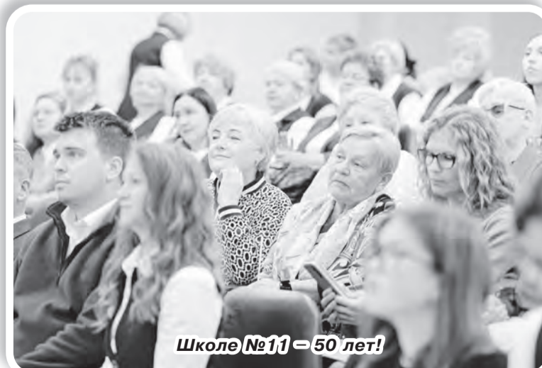
Школе №11 – 50 лет!