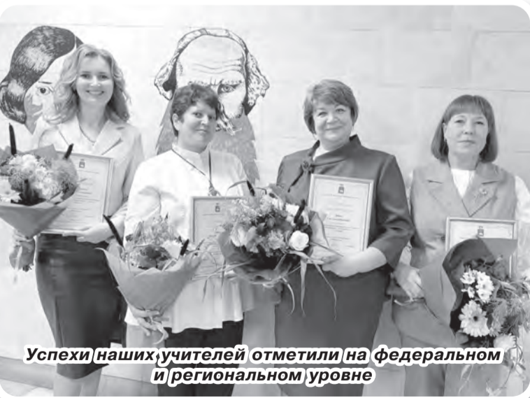
Успехи наших учителей отметили на федеральном и региональном уровне