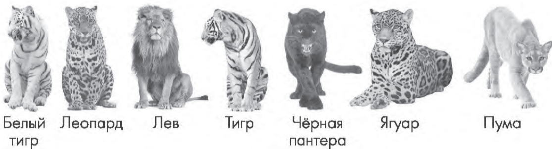
Белый тигр Леопард Лев Тигр Чёрная пантера Ягуар Пума