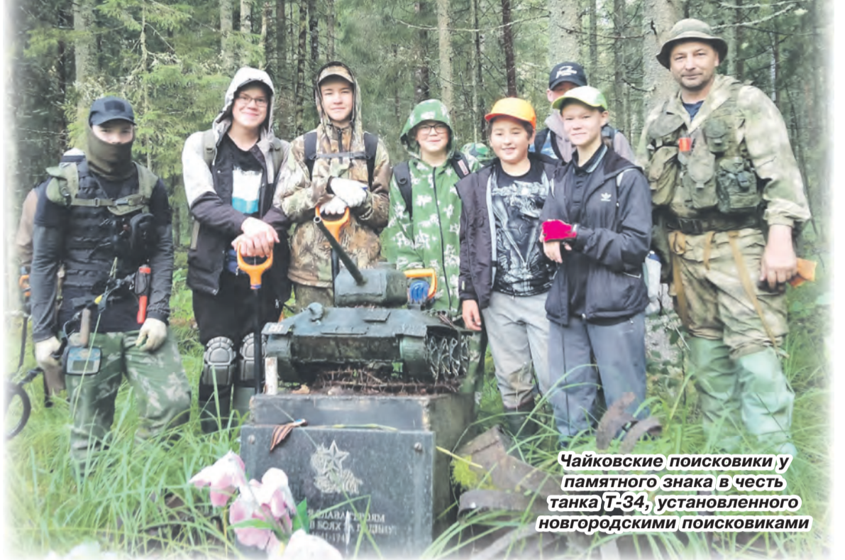
Чайковские поисковики у памятного знака в честь танка Т-34, установленного новгородскими поисковиками

Не все в экспедиции были знакомы между собой, но, как известно, костёр и песни сблизят – даже людей разных поколений. Возрастной диапазон поисковиков был очень широк – от четырнадцати и почти до семидесяти лет. Каждый вечер устраивались посиделки,