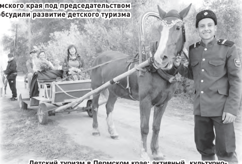
Детский туризм в Пермском крае: активный, культурно-познавательный, промышленный

С 2022 года в регионе реализуется программа социального заказа в сфере туризма. Это двухдневные детские поездки учащихся 5-9 классов. В результате инициативы в бесплатные путешествия уже отправилось порядка 21,4 тысяч школьников. В 2024 году финансирование мероприятия было обеспечено исключительно за счёт средств регионального бюджета, без федерального софинансирования. В октябре и ноябре 2025 года также за счёт средств регионального бюджета в поездки отправится 2 тыс. 500 ребят. Туроператорами, прошедшими отбор в реестр исполнителей услуги по социальному заказу, представлено более 30 маршрутов, в том числе патристические в рамках Года Защитника Отечества.