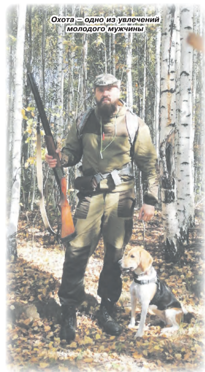
Охота – одно из увлечений молодого мужчины