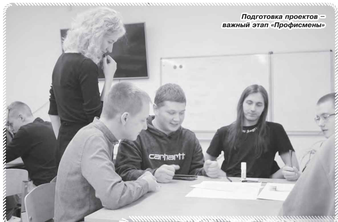
Подготовка проектов – важный этап «Профисмены»

Цель этого масштабного проекта – показать молодым людям, что в Пермском крае есть настоящая возможность реализоваться в профессиональной сфере. Поэтому «Профисмена» ставит своей задачей включение ребят в живой диалог со взрослыми – их потенциальными работодателями.