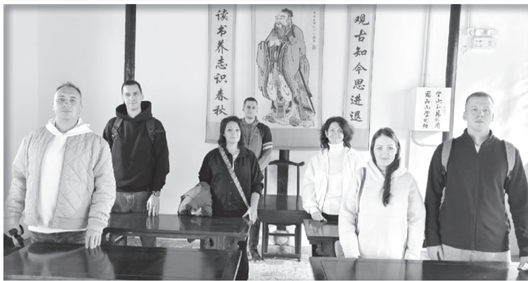
В одном из помещений Дворца небесной чистоты, где с детства обучались наследники императора Китая. Сзади – изображение древнекитайского мыслителя и философа Конфуция, перед которым благоговейно замирали будущие императоры и их учителя.