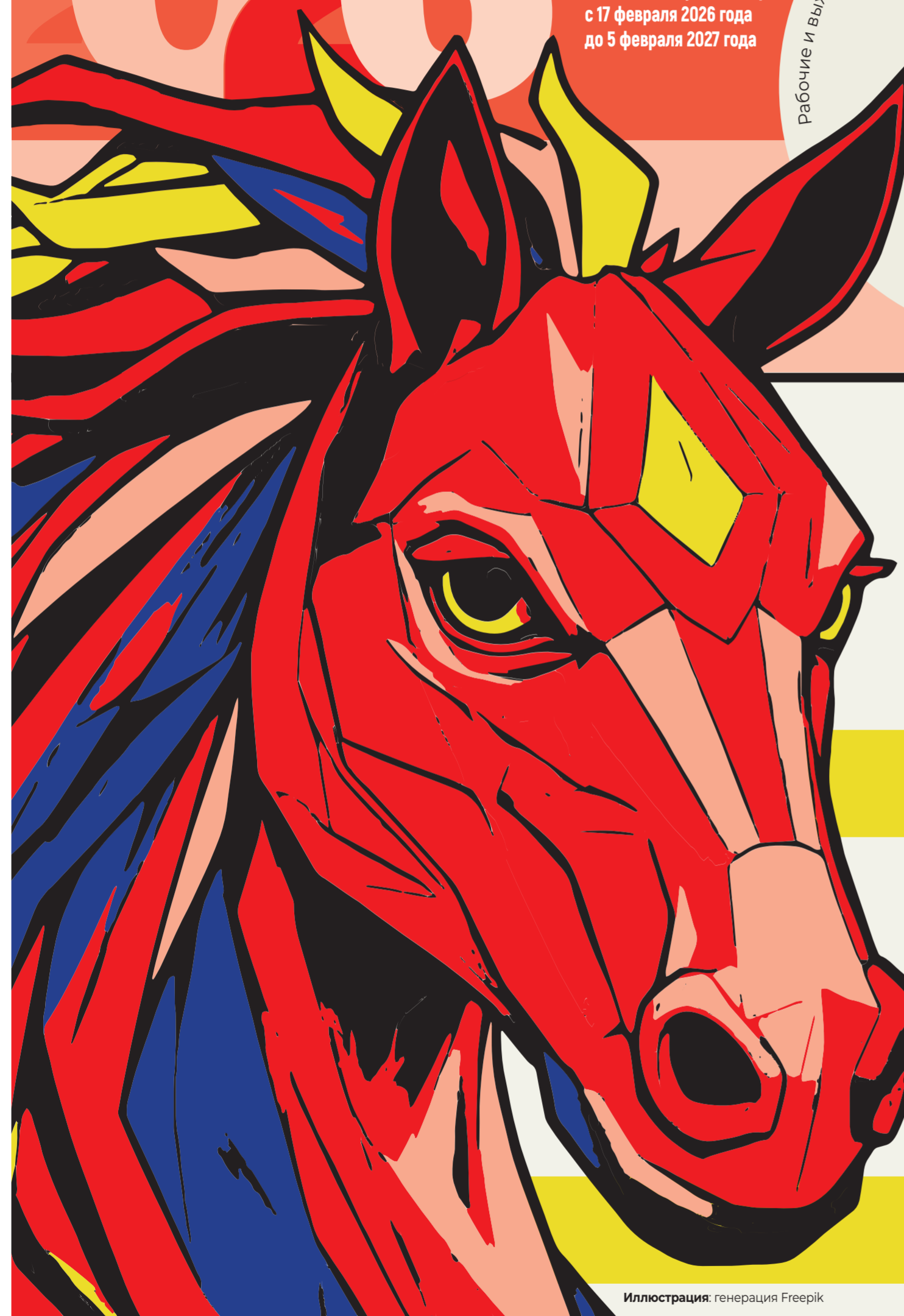
Иллюстрация: генерация Freerik