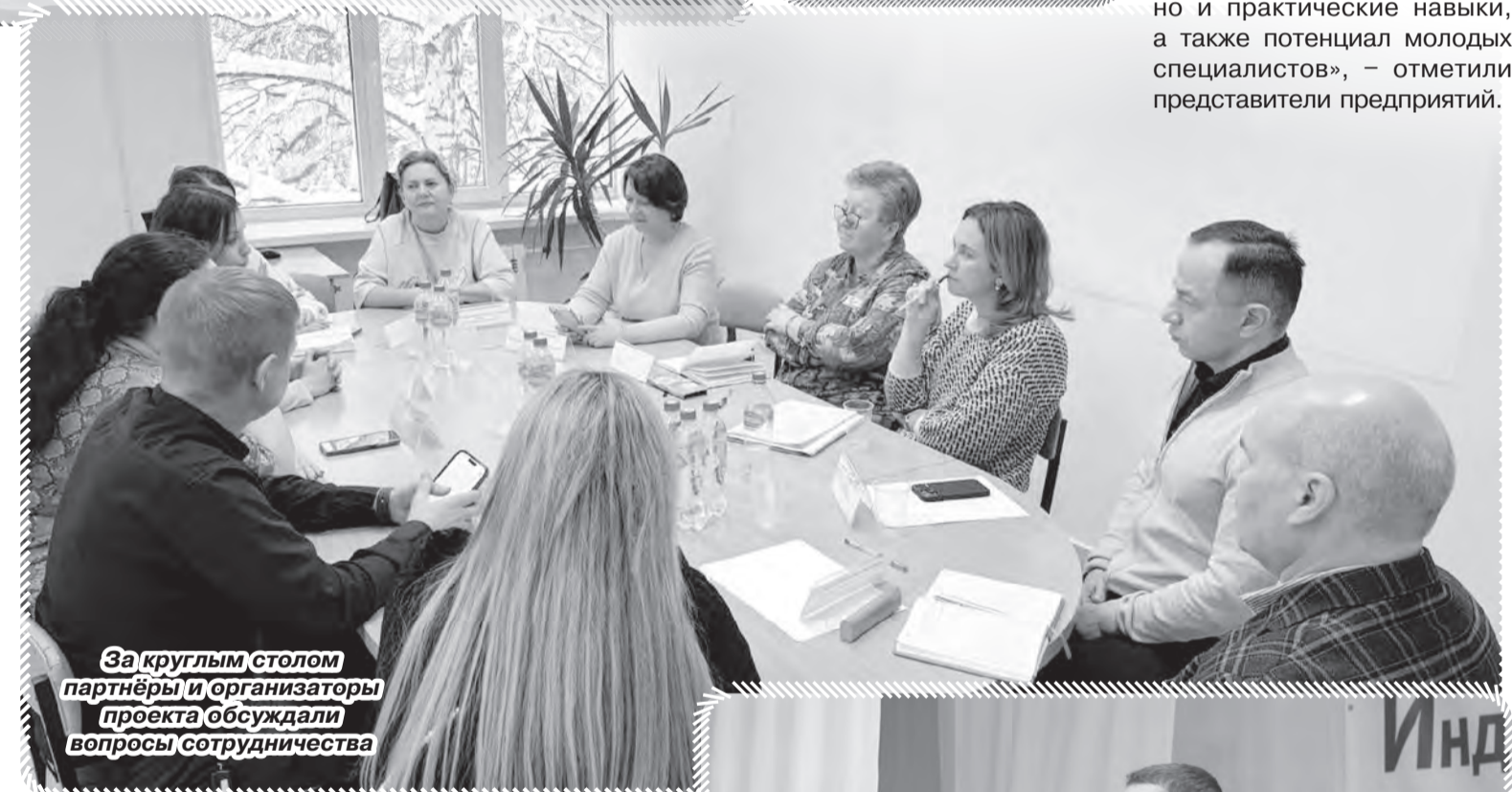
За круглым столом партнёры и организаторы проекта обсуждали вопросы сотрудничества

Проект «Профисмена», который удалось реализовать и в Чайковском, стал не просто ярмаркой вакансий, а настоящей возможностью построить свою будущую карьеру, не покидая родной город. Одно из мероприятий, которое состоялось в рамках этого проекта 9 декабря – открытый диалог и совместное творчество участников – студентов ЧИК, представителей администрации, а также ведущих предприятий региона. Участники разделились на тематические