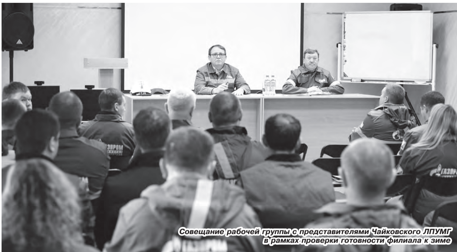
Совещание рабочей группы с представителями Чайковского ЛПУМГ в рамках проверки готовности филиала к зиме

ООО «Газпром трансгаз Чайковский» продолжает курс на обеспечение надёжной работы в зимний период, демонстрируя готовность объектов и сооружений к эксплуатации в предстоящем осенне-зимнем сезоне.