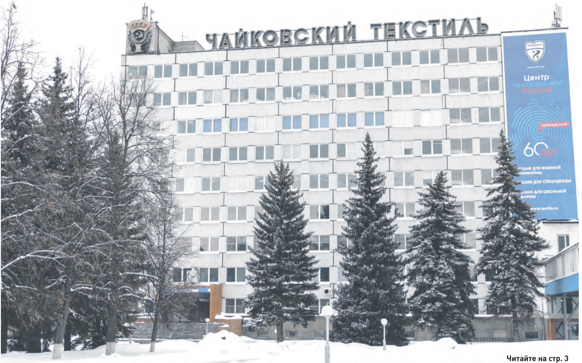
Читайте на стр. 3