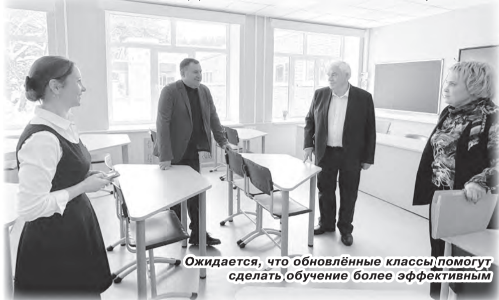
Ожидается, что обновлённые классы помогут сделать обучение более эффективным

Современно. Стильно. Уютно. Именно так, с восторгом и благодарностью, говорят ученики и педагоги 11-й школы про свои обновлённые кабинеты. Большие перемены, которые произошли в стенах учебного заведения, стали возможны благодаря партнёрству с группой компаний «Эрис».