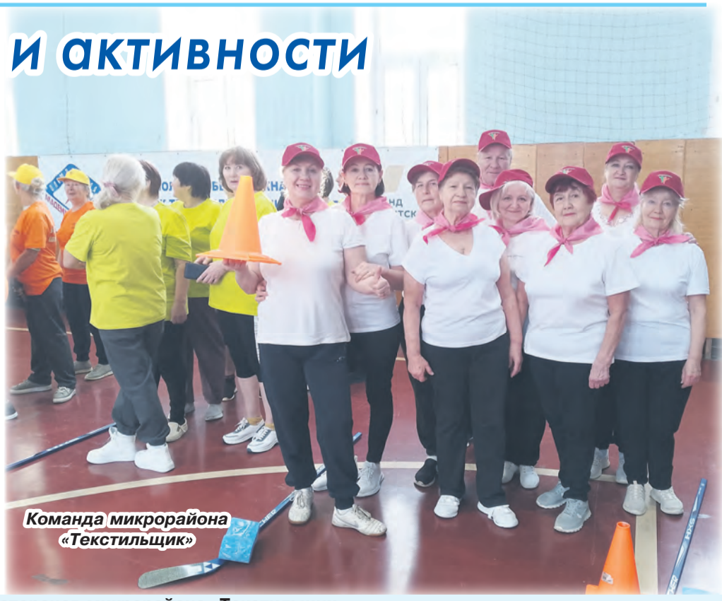
Команда микрорайона «Текстильщик»

Пятнадцать ветеранских команд округа собрались под одной крышей, чтобы не просто продемонстрировать свои спортивные таланты, но и зарядиться позитивной энергией. С первых минут состязаний атмосфера в зале стала поистине захватывающей. Несмотря на начальное волнение, поддержка товарищей вдохновляла и помогала преодолевать любые сомнения. Участники выкладывались с полной отдачей, стремясь к победе, и в каждом движении, в каждом броске, в каждом рывке проявлялись ловкость, точность, сила, быстрота, сплочённость. Можно смело сказать, что в этой спартакиаде проигравших не было. Каждый участник унёс с собой не только багаж ярких впечатлений, но и глубокое чувство удовлетворения от своего вклада – вне зависимости от заветного места на пьедестале. Подобные спортивные фестивали – это не просто мероприятия, а мощный стимул для поддержания активного и здорового образа жизни в унисон с национальным проектом «Продолжительная и активная жизнь». Для старшего поколения Спартакиада стала истинным праздником единения, где каждая команда, каждый человек ощутил себя частью одной большой, дружной семьи.