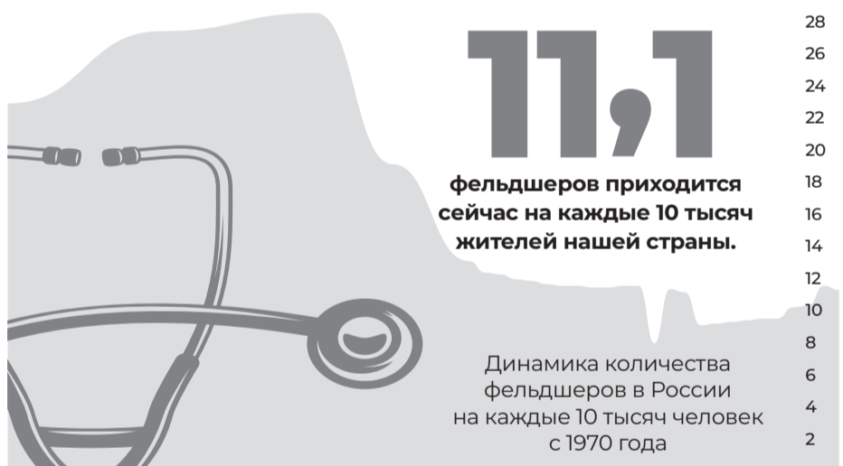
Динамика количества фельдшеров в России на каждые 10 тысяч человек с 1970 года.

Двадцать первое февраля – особая дата в российском календаре, посвящённая Дню фельдшера. Этот день – повод выразить глубокую признательность тем, кто стоит на передовой борьбы за здоровье нации, кто своим самоотверженным трудом обеспечивает доступность первичной медицинской помощи.