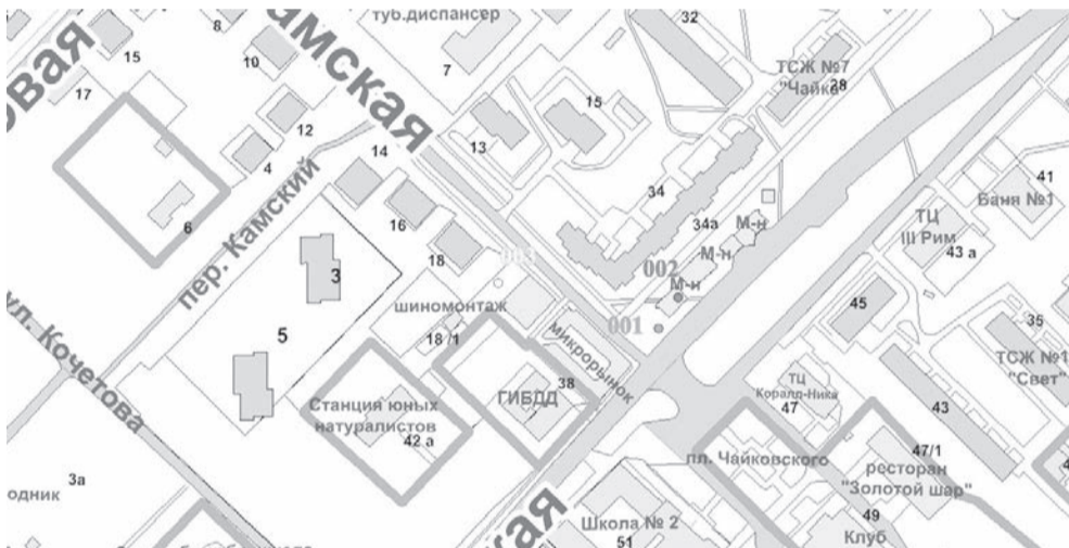
Выкопировки со Схемы размещения нестационарных торговых объектов Чайковского городского округа (графическая часть)

глава администрации Чайковского городского округа