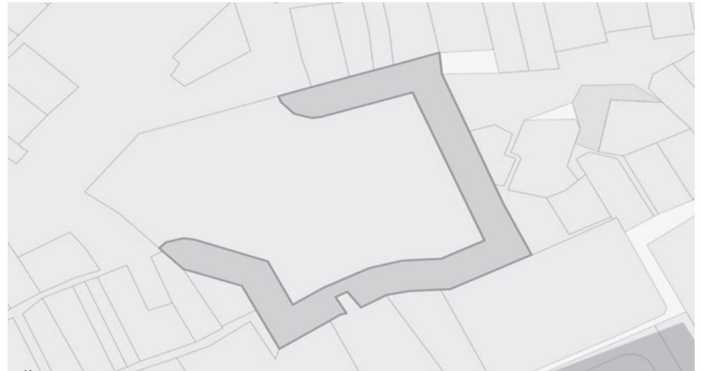
Координаты земельного участка:

Приложение 3 к постановлению администрации Чайковского городского округа от 17.02.2026 № 149